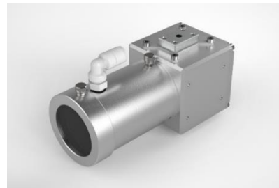
「サンアーク®アイ」外観