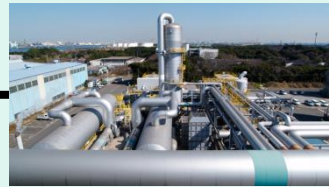
パイプラインで供給 (オンサイト)