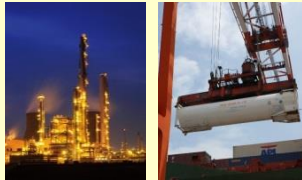
化学工場のオフガス 海外からコンテナ等で輸入