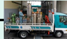
シリンダーによる供給 (パッケージガス)