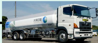
液化ガスローリー (バルク)